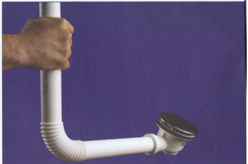
Flexydrain® PP-buis in combinatie met platte sifon voor douche (alle beelden doc. Plastiflex)

tweede product bestaat uit een gemofte PVC-buis (met lijmstof) in grijze uitvoering. Ook hier zijn er diverse lengten en de standaard diameters 32, 40 en 50 mm. De Plastiflex Flexydrain® buizen zijn verkrijgbaar in twee verschillende wanddiktes: 1,8 mm en 3 mm.