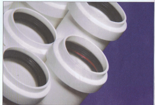
Flexydrain® in (witte) polypropyleen met dubbele O-ringen

tributeurs als van de talrijke vakbezoekers op onze stand logen er niet om. Ook andere landen, onder meer Spanje en Frankrijk, tonen nu al interesse in ons concept. De vraag naar Plastiflex Flexydrain® is zelfs dermate groot dat we enkele investeringen die op de markt van dit jaar gaan komen. Zowel in België als in Spanje komen er nieuwe lijnen in onze fabrieken om voldoende te kunnen